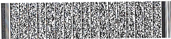
Timbre Electrónico S.I.I. Res. 106 del 2006 - Verifique documento: "www.sii.cl"

Haga sus pedidos al: 800 530 800 Desde celulares al: 600 290 9000 III, IV, V Reg. 600 690 9000 VI, VII, VIII, IX, X Reg. 530 0000 Región Metropolitana