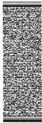
Timbre Electrónico S.I.L. Res. 50.09.27.03/2014 Verifique documento: www.sil.cl

Tipo de tarifa contratada: BT 3 PARCIALMENTE PRESENTE EN PUNTA