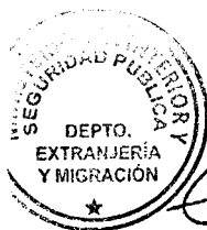
KATIUSKA LORCA SILVA Sección Visas

ABA/NVT/VGL/KLS/MAB [322]01/10/2019 Distribución: 1.- Policía Internacional 2.- Archivo