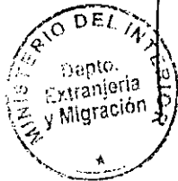
PATRICIA VASQUEZ SEPULVEDA SECCION VISAS

CDH/PVS/klS [308]14/06/2010 Distribución: 1.- Policía Internacional 2.- Archivo