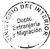
PATRICIA VASQUEZ SEPULVEDA SECCION VISAS

CDH/PVS/TA [323] 02/06/2010 Distribución: 1.- Policía Internacional 2.- Archivo