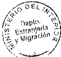
PATRICIA VASQUEZ SEPULVEDA SECCIÓN VIEAS

CDH/PVS/ace [323] 16/12/2010 Distribución: 1.- Policía Internacional 2.- Archivo