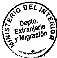
PATRICIA VASQUEZ SEPULVEDA SECCIÓN VISAS

CDH/PVS/kl [721]10/12/2010 Distribución: 1.- Policía Internacional 2.- Archivo