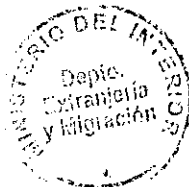
PATRICIA VASQUEZ SEPULVEDA SECCION VISAS

CDH/PVS/MAB [323] 01/12/2010 Distribución: 1.- Policía Internacional 2.- Archivo