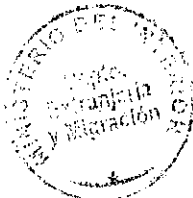
PAIRICIA VASQUEZ SEPULVEDA SECCION VISAS