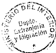
PATRICIA VASQUEZ SEPULVEDA SECCION VISAS

CDH/PVS/kls [323] 30/11/2010 Distribución: 1.- Policía Internacional 2.- Archivo